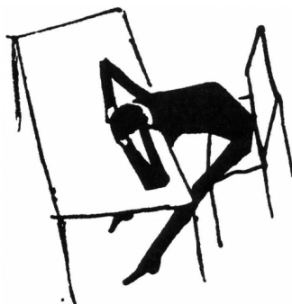
dessin de Franz Kafka

La rencontre de l'écrivain et de la petite fille est vraie : elle est mentionnée par Dora Diamant, l'amoureuse de Franz Kafka, dans ses mémoires. Les aventures de la poupée sont évidemment inventées. C'est le fruit de l'imagination de l'écrivain. Ce dernier utilise la fiction pour voler au secours du chagrin de la petite fille et lui faire oublier sa peine, faire le deuil de la perte de l'objet aimé, la poupée disparue. Ce n'est donc pas vrai, c'est inventé. Est-ce pour autant un mensonge ? C'est l'occasion d'aborder une petite discussion philosophique sur mentir et inventer.